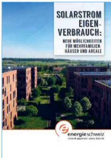
Broschüre für Eigenverbrauch in Mehrfamilienhäusern

Publikationen von EZS für das Bundesamt für Energie (BFE)