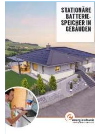
Broschüre zum Thema Batteriespeicher in Gebäuden