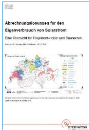
Übersicht zu Abrechnungslösungen für Eigenverbrauch