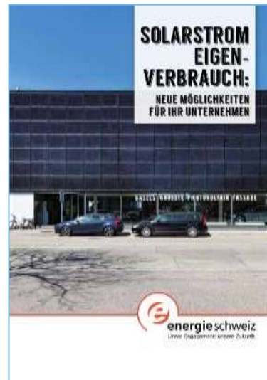
Broschüre für den Eigenverbrauch bei Unternehmen