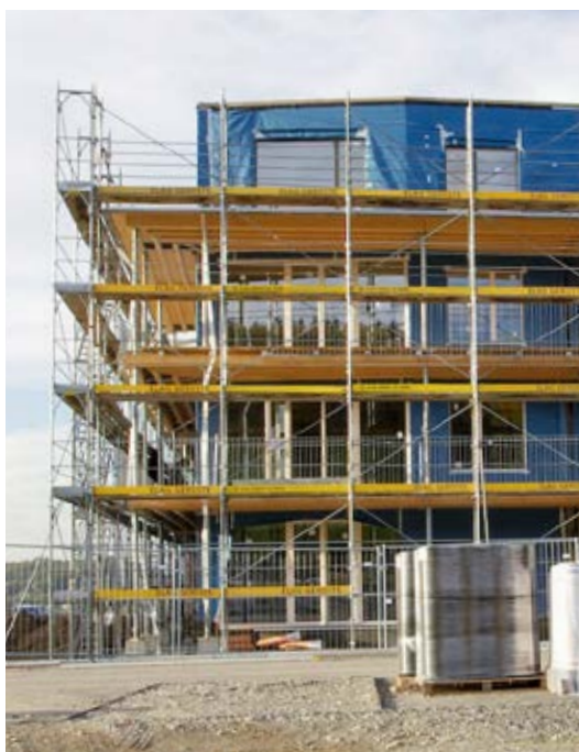
Wohnbaugenossenschaft Oberfeld, Bern